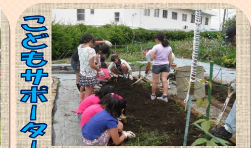
子どもサポーター