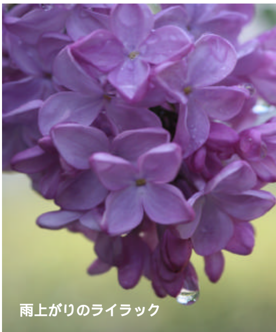
雨上がりのライラック