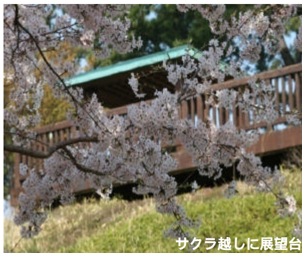
サクラ越しに展望台

都市化が進むなか市民に安らぎと潤いを与える緑の空間として、自然とのふれあいを回復する公園であるとともに、身近な緑化に関する啓発・普及活動の推進拠点である都市緑化植物園として、また、広域避難場所の機能を備え平成元年に開園した藤沢市の公園です。